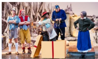
Szenenfoto „Der Räuber Hotzenplotz“

– Eine Geschichte über Tapferkeit und Freundschaft –