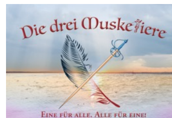
Langenargener Festspiele: Die drei Musketiere

Das diesjährige Abendstück verspricht ein spannungsgeladenes und dramatisches Theaterspektakel: