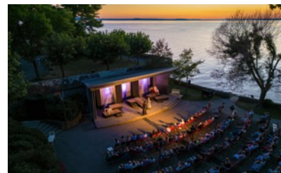
Außenspielfeld der Langenargener Festspiele